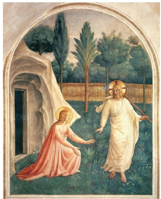
Fra Angelico XVème siècle

Pôle pastoral de la DDEC semaine du 7 au 13 avril 2024