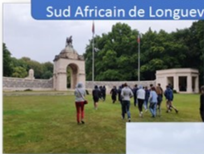
Arrivée au mémorial Sud Africain de Longueval