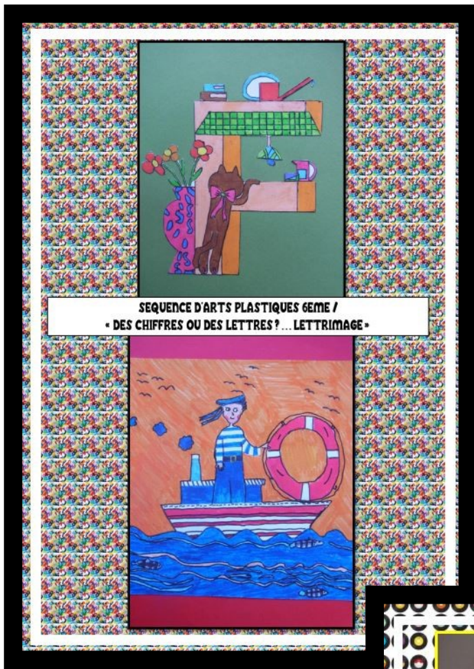
SEQUENCE D'ARTS PLASTIQUES 6EME / « DES CHIFFRES OU DES LETTRES? ... LETTRIMAGE »