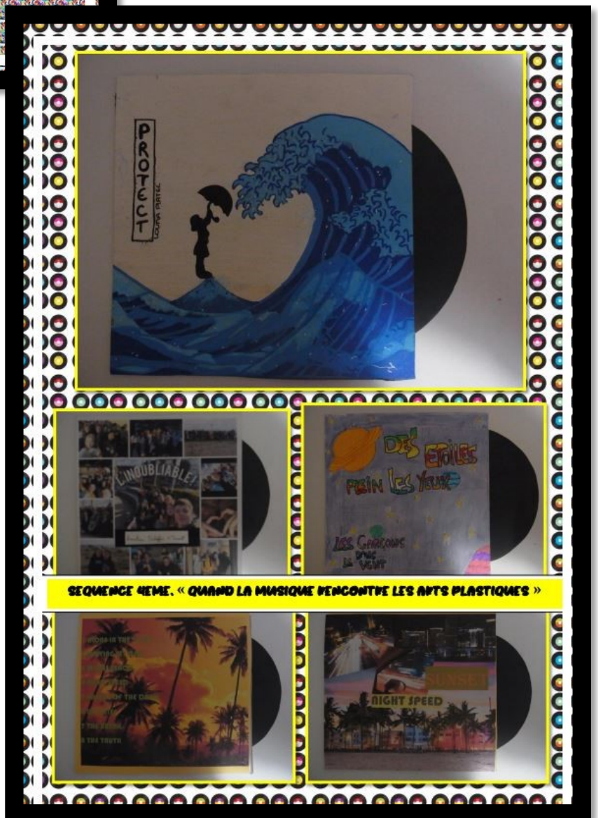
SEQUENCE 4EME. « QUAND LA MUSIQUE RENCONTRE LES ARTS PLASTIQUES »

Les 6eme ont travaillé la lettre et l'image et les 4eme ont créé une pochette de vinyle.